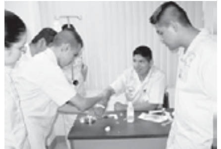
VISITA Alumnos de la Facultad de Enfermería tendrán la oportunidad de escuchar una plática de Alzheimer.