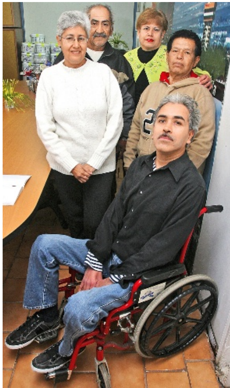
➤ La agrupación Venciendo la Distrofia Muscular y Espinal espera que a través de la información haya más conciencia de las discapacidades físicas.

A pesar de no causar dolor físico, con este padecimiento se va perdiendo la independencia paulatina-